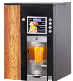
JDM ID 3 mit Barrique Oak Deko