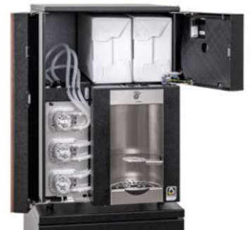
Platz für 3 x 5 l bag-in-box